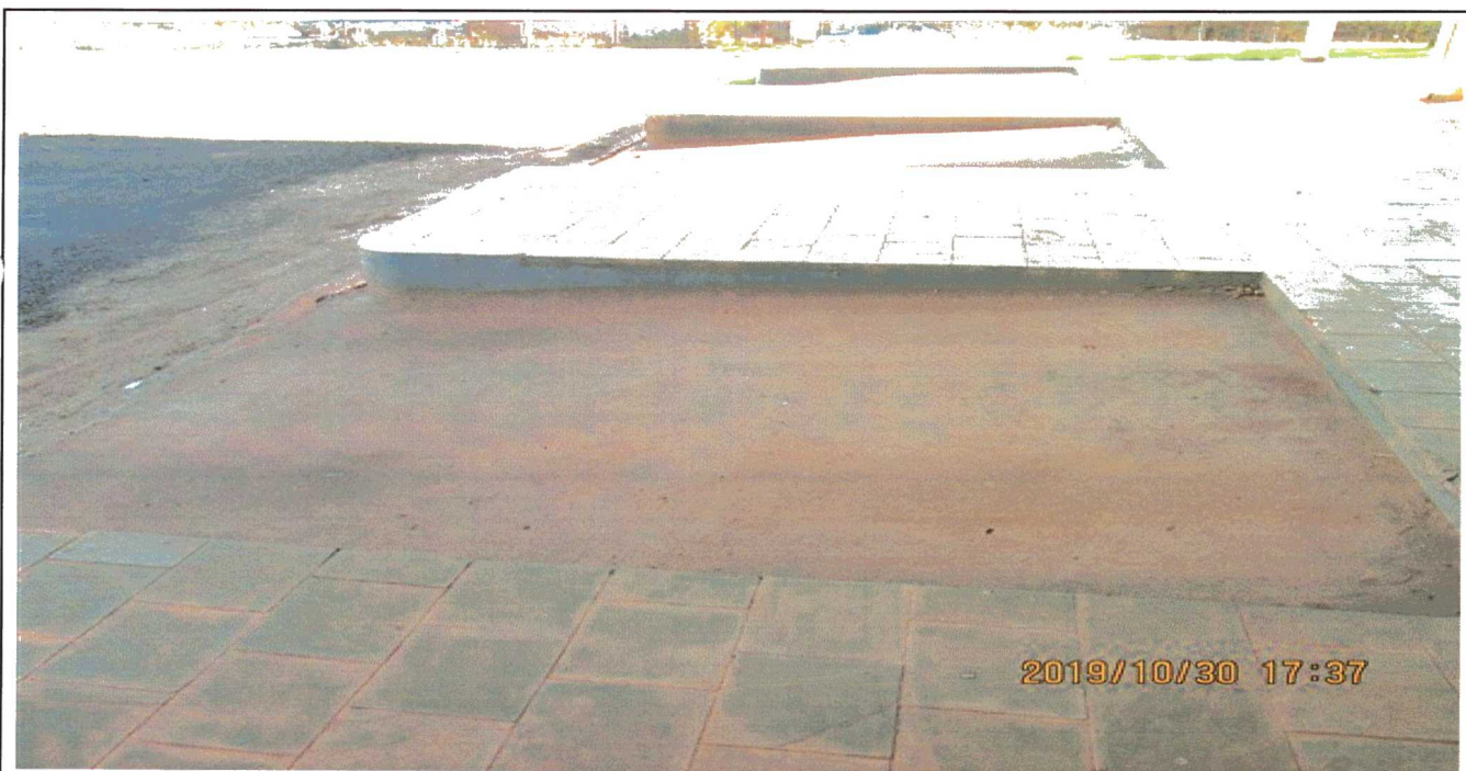
PARADA DE ONIIBUS