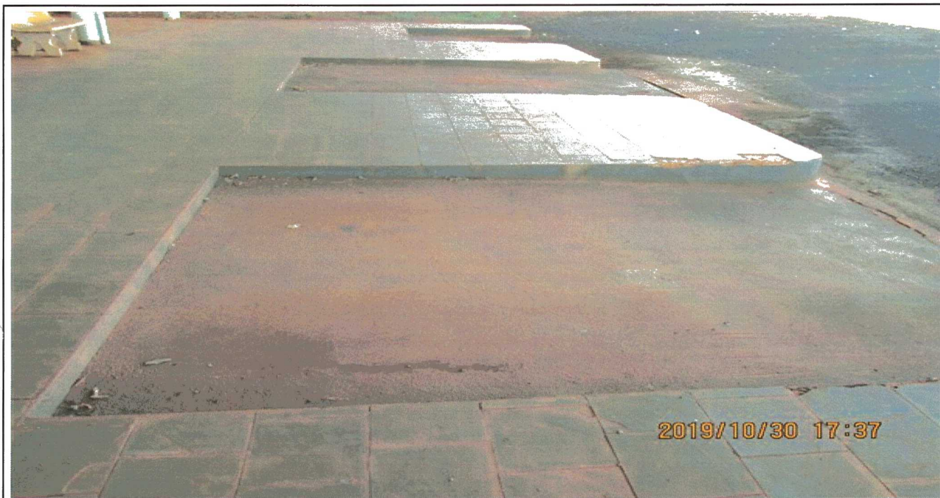
PARADA DE ONIBUS