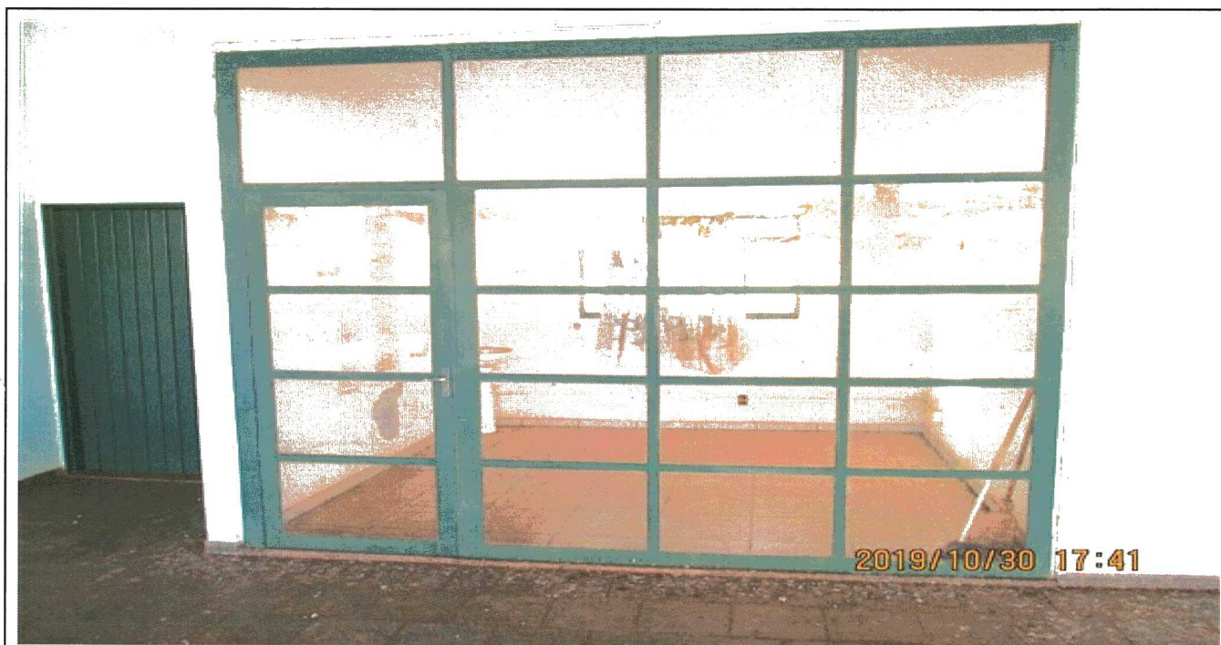
SALA DE INFORMAÇÕES TURÍSTICAS